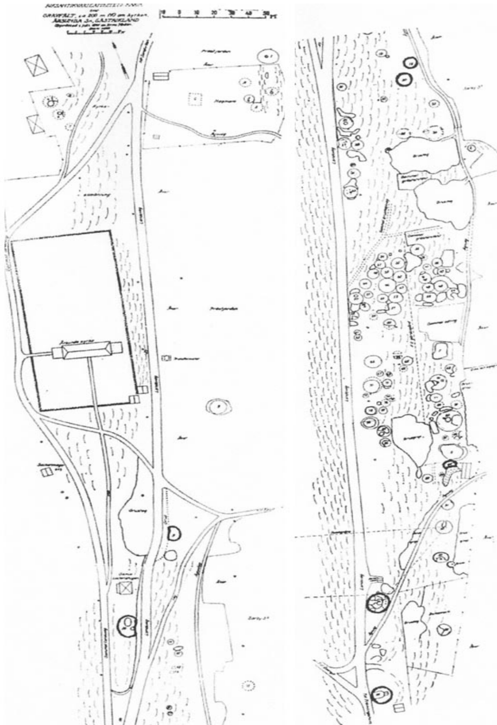
Fig 2: Sörbygravfältet. Karta från 1941 delad i två sektioner. Den norra delen till vänster. Ur "Arkeologiska undersökningar på gravfältet vid Årsunda" av Evert Baudou, s 23.