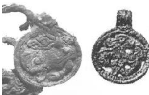
Fig 3 (v): Hänge, Grisskogen. Ur Grisskogen av Per Thorén, s 30.

långt från Årsunda. Detta fynd gjordes under utgrävningarna av gravfältet i Grisskogen i Storvik 1994. 15 Detta gravfält ligger på andra sidan Storsjön, sett från Årsunda, i den gamla socknen Ovensjö. Under dessa utgrävningar påträffade man bl a också flera hängsmycken i brons. 16 Det mest välbevarade av dem är slående likt det tidigare nämnda fyndet i Nissehögen (se bilder till vänster).